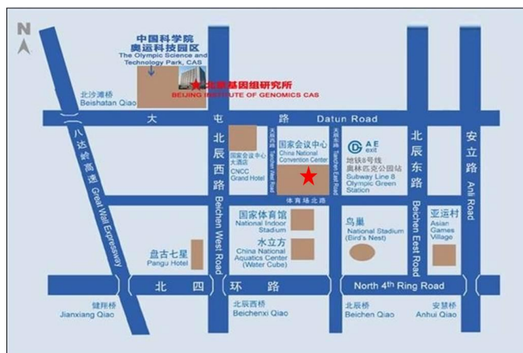
附 2：中国科学院北京基因组研究所、国家会议中心地理位置及周边住宿环境介绍